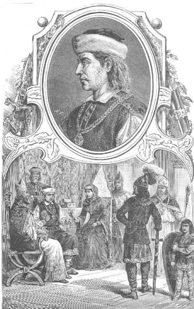
Władysław Herman z cyklu „Wizerunki książąt i królów polskich” Ksawerego Pillatiego z 1888 roku

Władcą Polski w okresie bitwy pod Drzycimiem był Władysław I Herman z dynastii Piastów, syn Kazimierza Odnowiciela. Panował w latach 1079-1102, po wygnaniu jego brata króla Bolesława Śmiałego (Szczodrego) za zabicie biskupa krakowskiego św. Stanisława ze Szczepanowa. Przez część tego okresu władzę w jego imieniu sprawował palatyn Sieciech, zarządca dworu królewskiego i wojewoda. W roku 1090 na krótko podporządkował Polsce Pomorze. Obsadził swoimi załogami ważniejsze grody, a pozostałe w oznaczonym dniu i godzinie rozkazał spalić. Miało to zapobiec buntom. Ustanowieni przez księcia dowódcy grodów popełniali wielkie nadużycia, za co część ich została zabita przez Pomorzanie, a uczciwszym umożliwiono ucieczkę. Odwetowa wyprawa polska zakończyła się opisywaną bitwą. Po bitwie Sieciecha nad Wdą zaczął się okres wzajemnych pogranicznych najazdów, które skończyło dopiero podbicie Pomorza przez Krzywoustego, syna księcia Władysława.