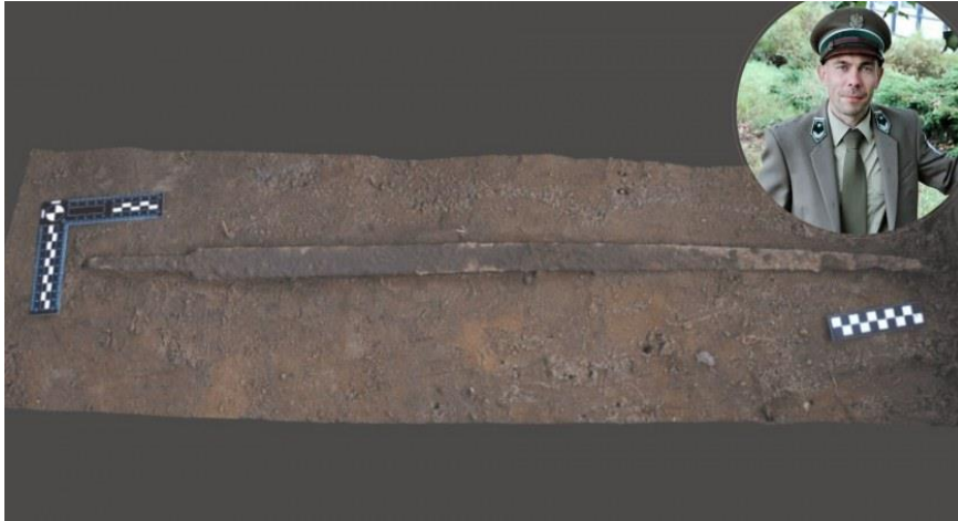
Langsaks znaleziony w okolicy Gródka (Nowe Świecie 23.01.2022)

W 2021 roku nad Zalewem Gródeckim (na Wdzie) znaleziono nóż bojowy, prawdopodobnie tzw. langsaks, pochodzący z połowy VIII wieku, czyli z okresu około 350 lat przed bitwą. Nie jest on jednak powiązany z opisywaną walką.