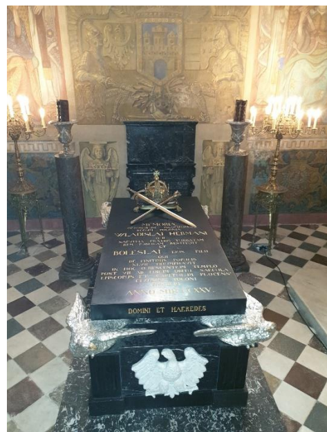
Sarkofag Władysława Hermana w katedrze płockiej