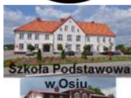
Szkoła Podstawowa w Osie